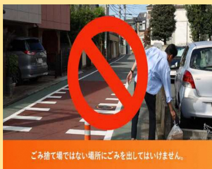
ごみ捨て場ではない場所にゴミを出してはいけません。