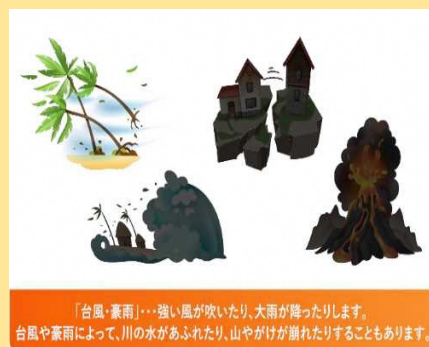
「台風・豪雨」…強い風が吹いたり、大雨が降ったりします。台風や豪雨によって、川の水があふれたり、山やがけが崩れたりすることもあります。